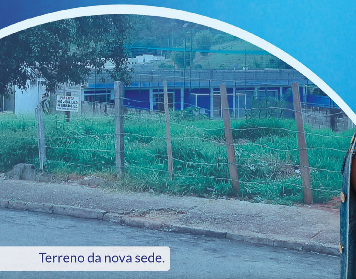
Terreno da nova sede.

Os serviços oferecidos atualmente continuam com atendimento na Rua João Mendes, 67, Centro.